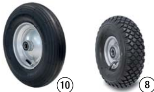
Räder luftbereit für Sackkarren und Schubkarren