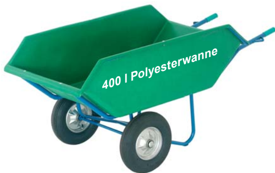
Universal- und Futterkarren Polyester Wanne grün, 400L Fassung, 800 mm breit, stabiler Stahlrohr Rahmen, lackiert, Lufträder 400x100 4PR mit Kugellager, bewährt seit vielen Jahren. Nr. 1022215

Für den Transport dieser drei sperrigen Kombi-Karren berechnen wir einen Frachtanteil von 15,- € pro Stück.