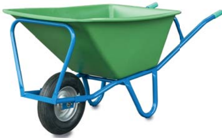
Kombi-Karren, Einradausführung Kunststoff Mulde grün, 220L Fassung, 730 mm breit, stabiler Stahlrohr Rahmen, lackiert, Luftrad 400x100 4PR mit Kugellager Nr. 1025