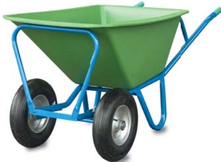
Kombi-Karren, mit zwei Räder Kunststoff Mulde grün, 220L Fassung, 730 mm breit, stabiler Stahlrohr Rahmen, lackiert, Lufträder 400x100 4PR mit Kugellager 1026